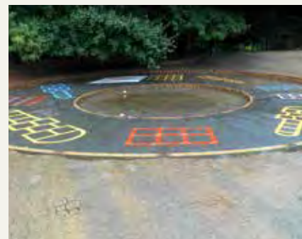
Création de jeux au sol : marelles, escargot, couloirs de course.