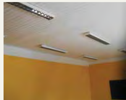
Élémentaire Bouton : réfection des peintures de classes.