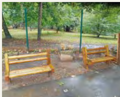
Maternelle Érables : création de bancs.