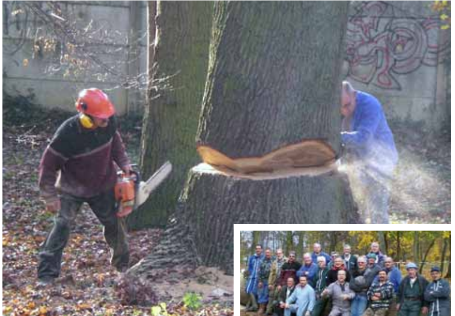
▲ L'abattage d'un gros chêne malade, au parc des Érables.

Au moment du déjeuner les épouses les rejoignent pour un pique-nique autour du feu.