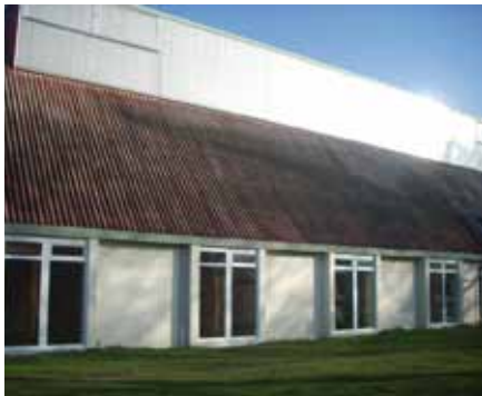
▲ Salle polyvalente : remplacement des baies vitrées