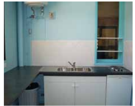
▲ Groupe scolaire Les Érables : réfection complète de la tisanerie