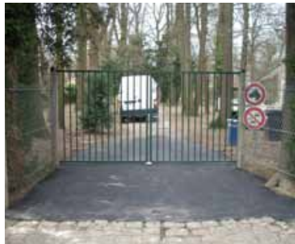
▲ Parc des Érables : pose d'un portail d'accès au parc, avenue de Séquigny, avec bitume au sol