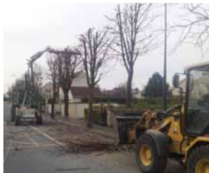
▲ Élagage : élagage avenue du Grand Orme et Gardes Messiers