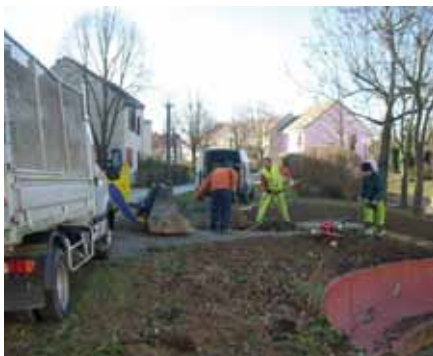
▲ Square Bassompierre : arrachage de haies et remise à niveau des pelouses