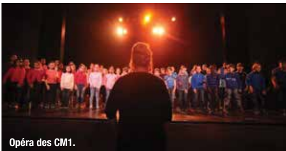
Opéra des CM1.