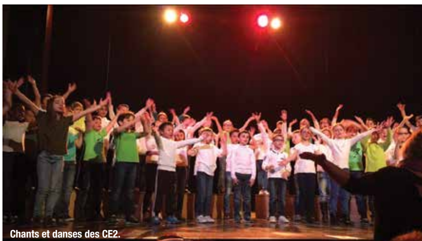
Chants et danses des CE2.