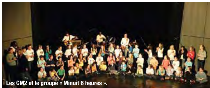
Les CM2 et le groupe « Minuit 6 heures ».