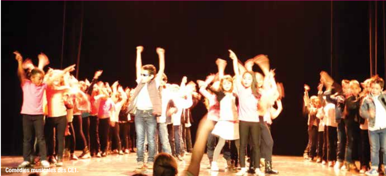
Comédies musicales des CE1.