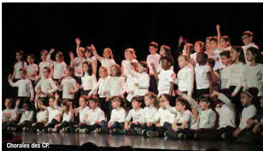
Chorales des CP.